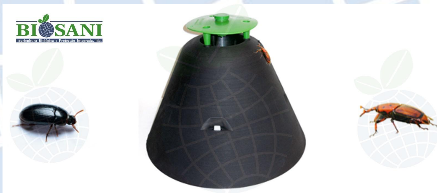
Figura 1.1 - Figura ilustrativa, não à escala real, da armadilha Rhynchophorus ferrugineus (Picusan®) com todos os componentes montados no local de monitorização. À esquerda apresenta-se o adulto de Agriotes spp e à direita o adulto de Rhynchophorus ferrugineus , duas das pragas-alvo em que a utilização da armadilha é aconselhada. Nota: O difusor de feromona e/ou atrativo específico para a praga-alvo é adquirido à parte (consulte a informação para o difusor específico de cada praga-alvo).

Armadilha Rhynchophorus ferrugineus (tipo Pitfall) em polipropileno (PP) preto com prato coletor interno também em PP (branco) para a monitorização e captura de coleópteros adultos do escaravelho-vermelho-das-palmeiras ou gorgulho-vermelho-das-palmeiras ( Rhynchophorus ferrugineus ) e outros ( Agriotes spp. e Melolontha spp.), cujas larvas causam sérios danos em palmeiras, tamareiras e coqueiros, tal como noutras culturas de interesse agrícola ou paisagístico. A praga é atraída para o interior da armadilha utilizando um difusor de feromona e/ou atrativo (adquirido à parte - consulte a informação referente ao difusor específico para a praga-alvo) (ver figura 1.1). Os insetos atraídos pelo odor libertado do difusor escalam a parede exterior rugosa do corpo piramidal da armadilha acabando por cair na abertura do funil existente no topo do corpo e são encaminhados para o interior do prato coletor onde ficam retidos, acabando por sucumbir no interior do mesmo.