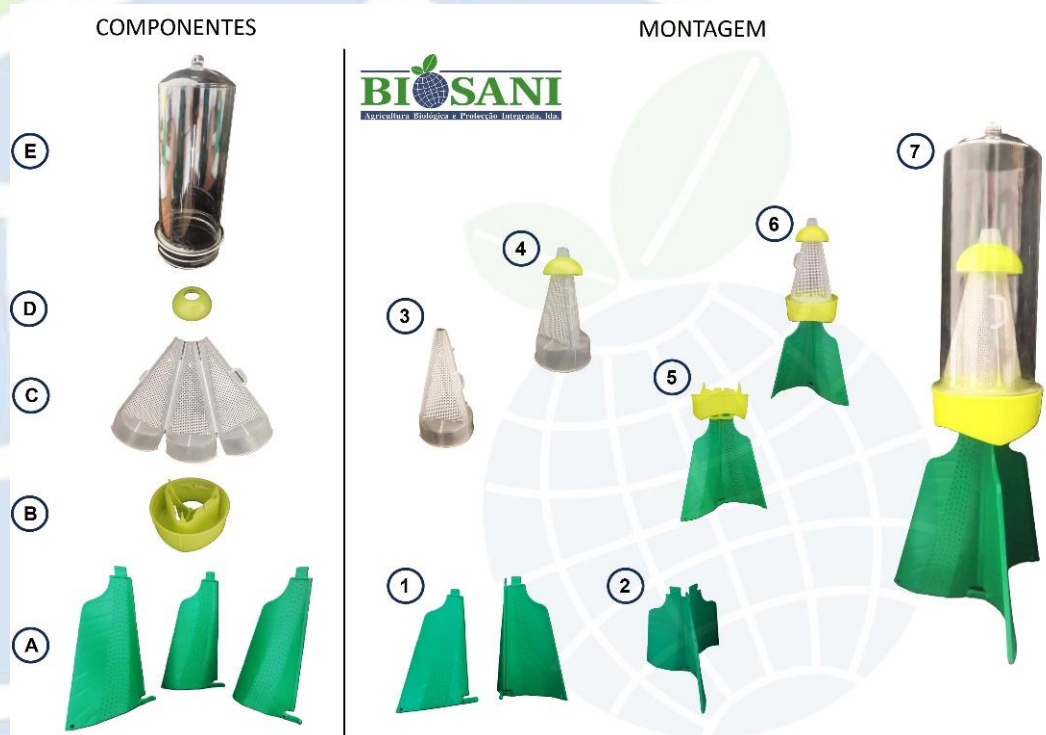
Figura 3.1 - Componentes individualizados e múltiplos passos para a montagem dos componentes que constituem a armadilha mini-piramidal Halyomorpha halys . Componentes: A - Alhetas piramidais individualizadas que constituem a base piramidal após montagem; B - Corpo de agrupamento; C - Cone acesso interno; D - Chapéu de retenção; E - Copo coletor. Montagem: 1 - Encaixe de 2 alhetas piramidais iniciais; 2 - Encaixe da 3ª e última alheta piramidal; 3 - Montagem do cone de acesso interno; 4 - Montagem do chapéu de retenção no cone interno; 5 - Montagem do corpo de agrupamento na base piramidal; 6 - Montagem do cone interno no corpo de agrupamento; 7 - Montagem do copo coletor (colocar o difusor de feromona e atrativo no interior do copo coletor antes de montar o mesmo no corpo de agrupamento - executar este passo com o copo e a base na horizontal para conservar o difusor no interior).

Para colocar o difusor de feromona / atrativo no interior da armadilha deve utilizar sempre luvas (não tocar com os dedos no difusor após abertura da embalagem). Desenrosque o copo coletor do corpo de agrupamento. Coloque o copo de coletor em posição horizontal e instale o difusor no interior livremente ( Atenção: não deve abrir o difusor , o material deste é permeável e permite a difusão gradual do conteúdo). Após colocar o difusor, volte a enroscar o copo coletor ao corpo de agrupamento para fixar a estrutura da armadilha contendo o difusor no seu interior (o difusor fica livre no interior do copo coletor). Pode realizar esta operação previamente em local abrigado (fora do campo) ou no próprio local de monitorização (no campo).