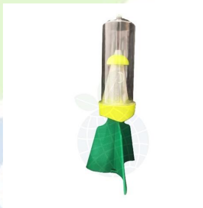
Figura 2.1 - Aspeto da armadilha mini-piramidal com os componentes totalmente montados (instruções para montagem - consulte o ponto 3 da presente ficha técnica).

colocação do difusor de feromona e atrativo (adquirido à parte), a armadilha pode ser instalada no local de monitorização da praga (ancorar no solo utilizando arame ou suspender num ramo / perna utilizando um fio que passa no orifício localizado no topo do copo coletor - material para ancoragem ou suspensão não fornecido).