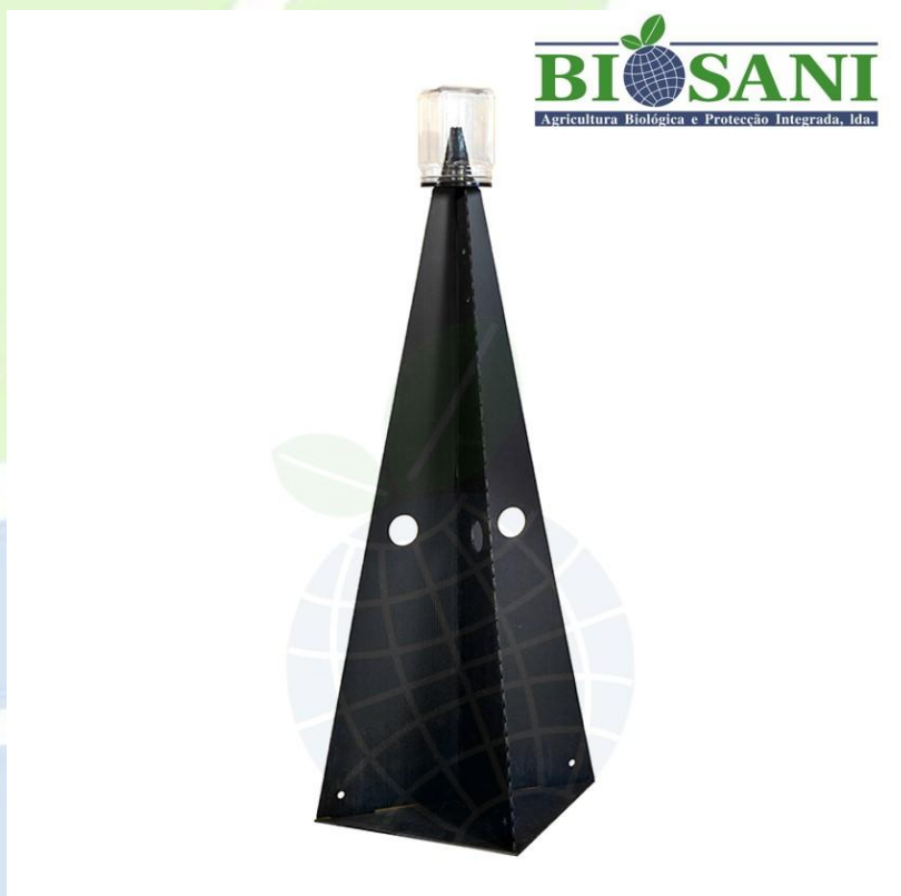
Figura 2.1 - Aspeto da armadilha piramidal com os seus componentes montados (não se encontram representados na imagem os pinos de ancoragem e a corda elástica para a fixação do copo - ambos fornecidos).

Os componentes da armadilha piramidal Cymatrap® Pro Halyomorpha halys apresentam as seguintes características: