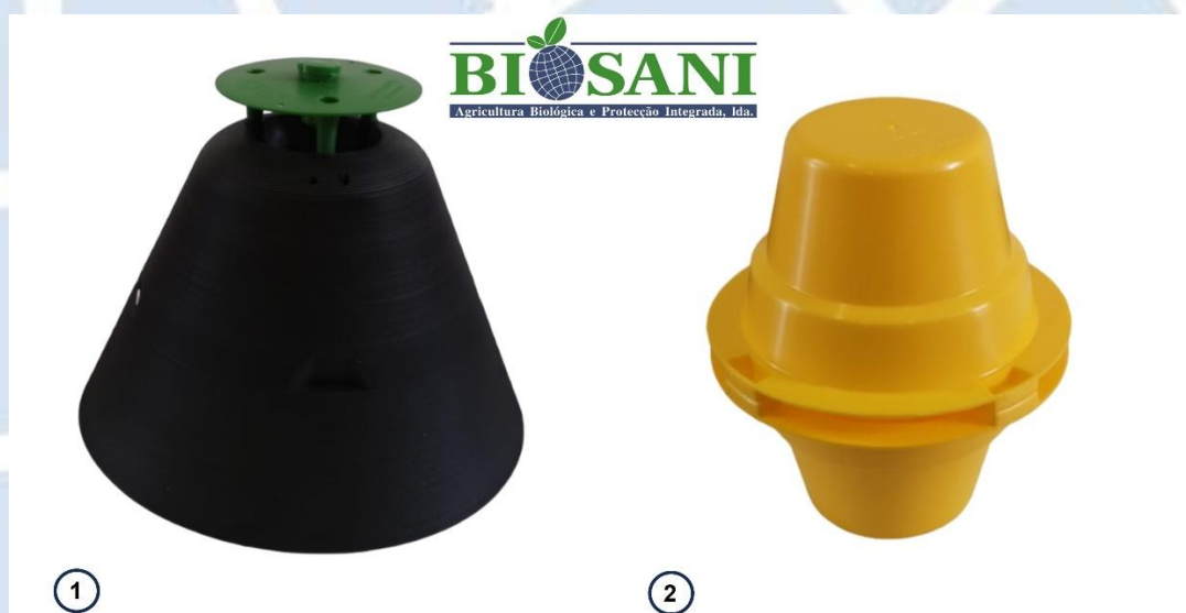
Figura 11.1 - Instruções de montagem do difusor na armadilha Rhynchophorus ferrugineus (1) e na armadilha Cosmopolites sordidus (2).

11 - Armadilha: Aconselha-se o uso da armadilha Rhynchophorus ferrugineus (tipo pitfall) (ver figura 11.1.1) para a captura deste inseto. A cor e o formato desta armadilha tornam-na muito eficaz na monitorização e controlo da praga. Instale as armadilhas a pelo menos 10 metros dos troncos das árvores. Poderá igualmente utilizar a armadilha Cosmopolites sordidus (necessita enterrar a parte inferior, de forma que a abertura fique nivelada com a superfície do solo) (ver figura 11.1.2), igualmente uma pitfall.