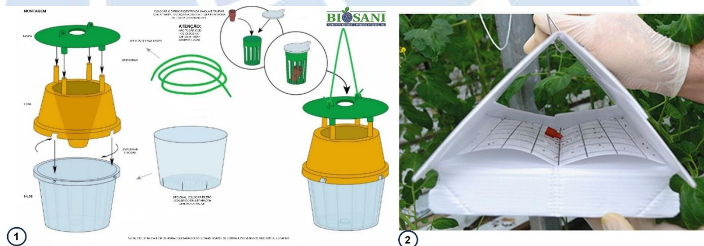
Figura 11.1 - Instruções de montagem do difusor na armadilha de funil (1) e na armadilha delta (2). O tubo de polietileno (Fig. 10.1) deve ser instalado na mesma posição que o difusor de borracha vermelha que se encontra ilustrado na Fig.11.1 (imagem 1 e 2), mas em posição vertical e com a tampa para cima.

11 - Armadilha: Aconselha-se o uso da armadilha de funil (ver figura 11.1.1) ou delta (ver figura 11.1.2) para a captura deste inseto. Instalar as armadilhas na cultura, à altura de onde se espera que o inseto atue. A armadilha de funil aconselhada é a com tampa verde, funil amarelo e copo transparente, no entanto, poderá utilizar outras combinações. Alertamos que o amarelo poderá atrair abelhas.