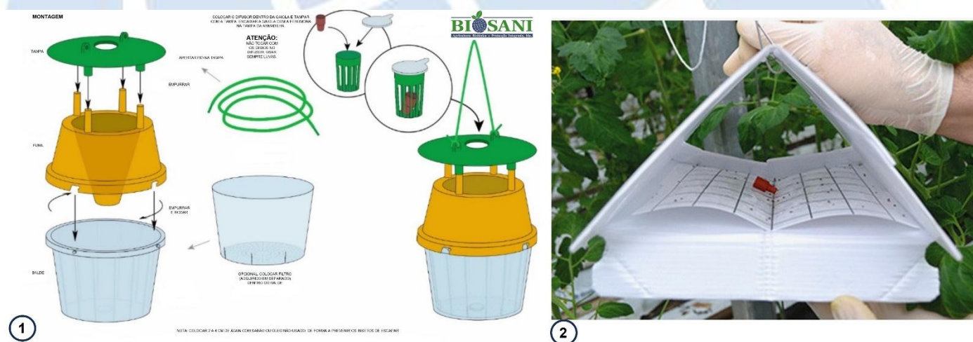
Figura 11.1 - Instruções de montagem do difusor na armadilha de funil (1) e na armadilha delta (2). O tubo de polietileno (Fig. 10.1) deve ser instalado na mesma posição que o difusor de borracha vermelha que se encontra ilustrado na Fig.11.1 (imagem 1 e 2), mas em posição vertical e com a tampa para cima.

11 - Armadilha: Aconselha-se o uso da armadilha de funil (ver figura 11.1) ou delta (ver figura 11.2) para a captura deste inseto. Instalar as armadilhas na cultura, à altura onde se espera que o inseto atue. A armadilha de funil aconselhada é a com tampa verde, funil amarelo e copo transparente, no entanto, poderá utilizar outras combinações. Alertamos que o amarelo poderá atrair abelhas.