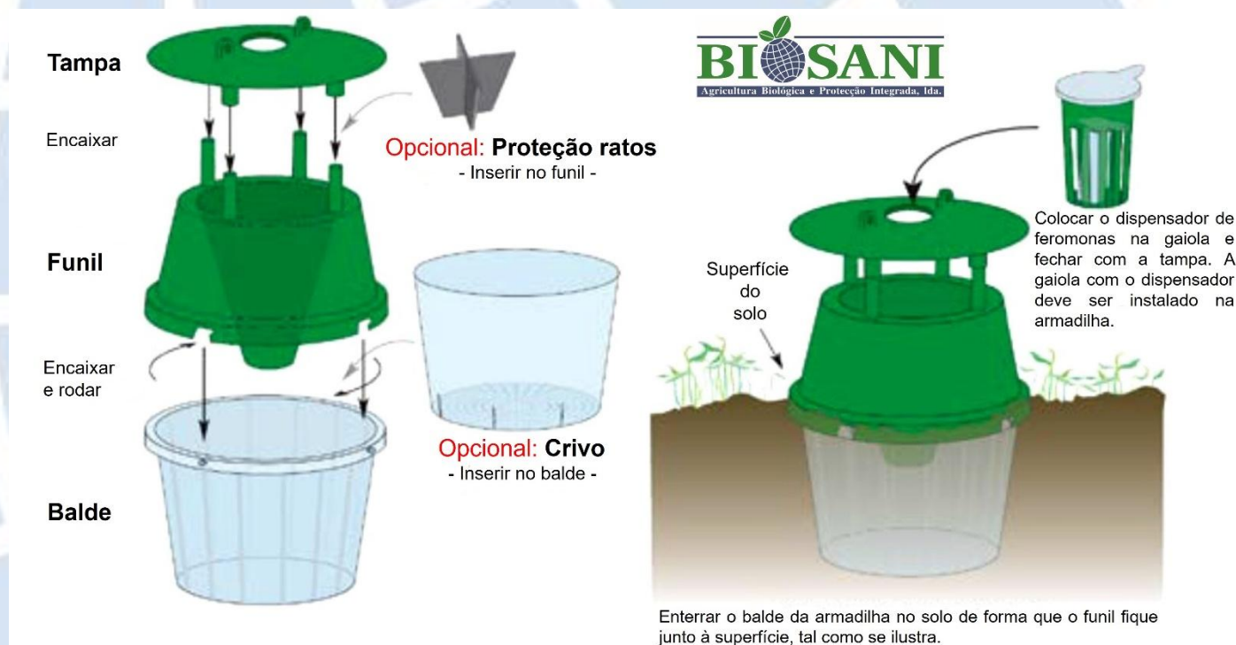
Figura 11.1 - Instruções de montagem da armadilha de funil e do dispensador de feromonas. O tubo de polietileno (Fig. 10.1) deve ser instalado em posição vertical e com a tampa para cima no interior da gaiola, sendo esta colocada no orifício existente na tampa da armadilha.

11 - Armadilha: Aconselha-se o uso da armadilha de funil (ver figura 11.1) para a captura destes insetos. Instalar a armadilha na cultura, enterrada parcialmente no solo como se ilustra na figura 11.1. A armadilha de funil aconselhada é a com tampa verde, funil verde e copo transparente.